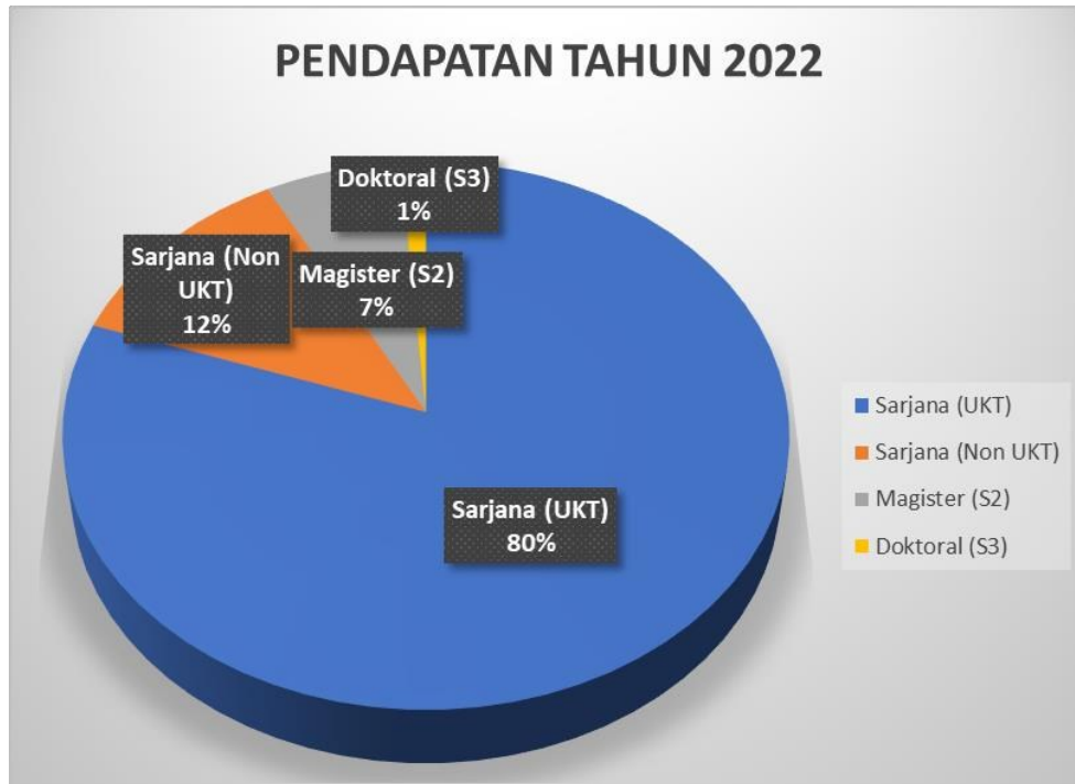
Gambar 1. Realisasi Pendapatan Keuangan FTIP dari Tuition Program Sarjana dan Pascasarjana